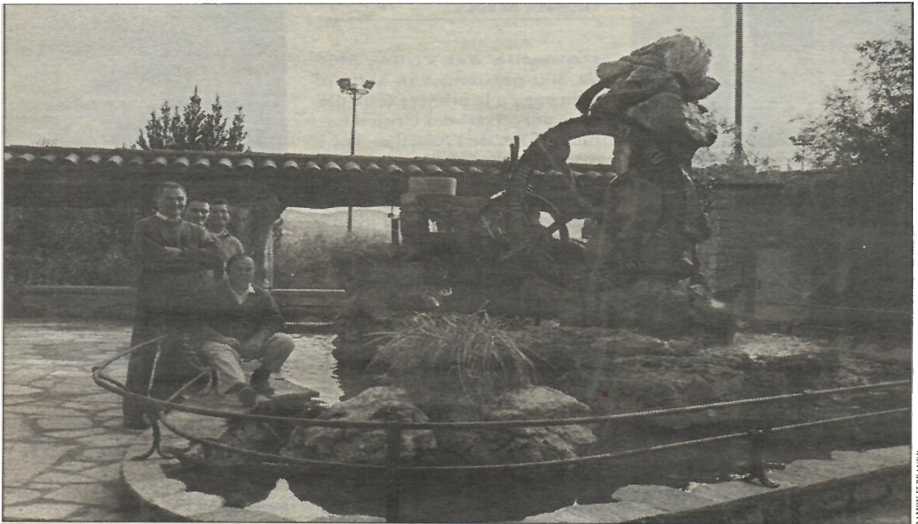
El rellotge d'aigua de Ferran Capdevila està situat al pati del restaurant Can Traver de Bigues